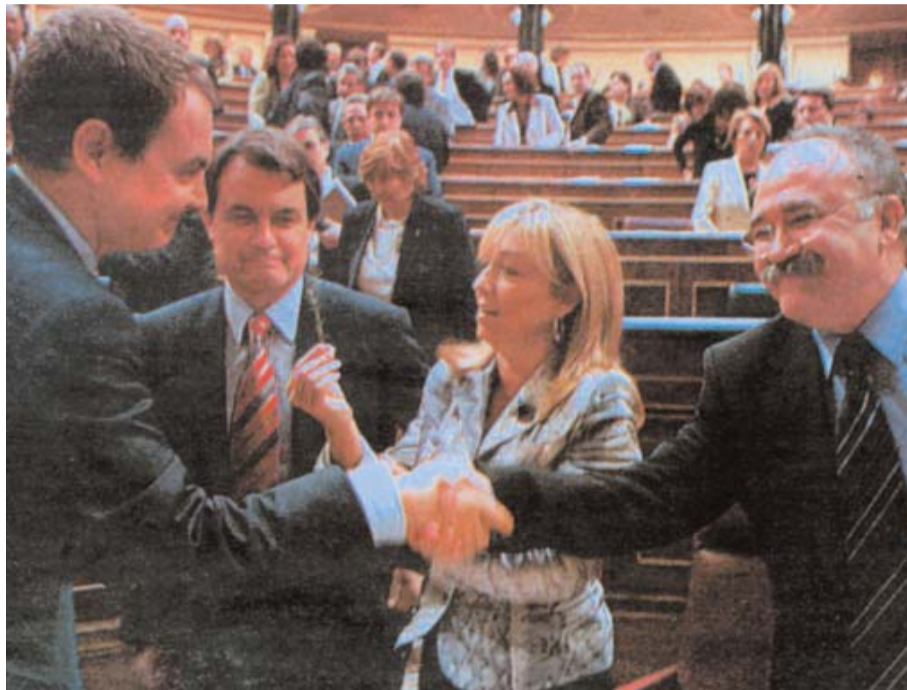
La mayoría social por una unidad basada en la pluralidad y la solidaridad es amplísima. Quienes son minoría, a pesar de la relevancia que se les otorga, son los insolidarios y los partidarios de la disgregación.

¿Dónde está pues el problema? ¿En que “Cataluña no se siente cómoda en España”? ¿Contamos los ministros catalanes en los últimos 25 años? ¿Y los presidentes catalanes de bancos y monopolios?