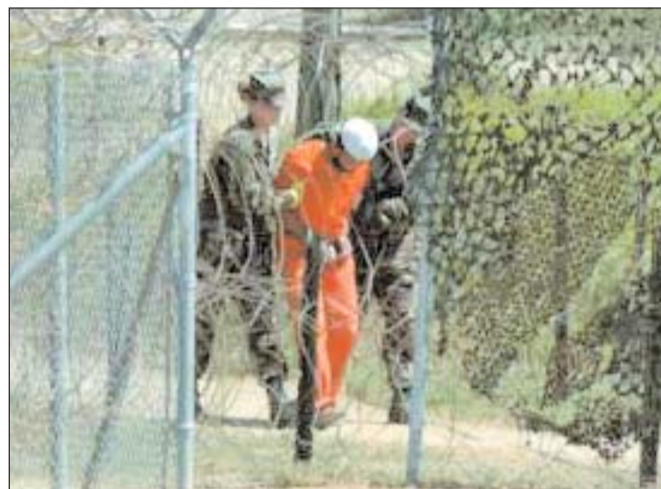
En estas cárceles secretas los agentes de la CIA tienen autorización para utilizar lo que la agencia llama “técnicas ampliadas de presión en los interrogatorios”, un eufemismo para denominar distintos métodos de tortura que violan la Convención de la ONU contra la Tortura.

Durante la instrucción del caso lo que ha salido a la luz es cómo la identificación de la espía (esposa de un diplomático que denunció las mentiras de la administración Bush para intoxicar a la opinión pública y crear un clima de opinión favorable a la guerra de Irak) formaba parte de una campaña –diseñada en los aledaños de la Casa Blanca– dirigida a desacreditar públicamente al matrimonio y arruinar