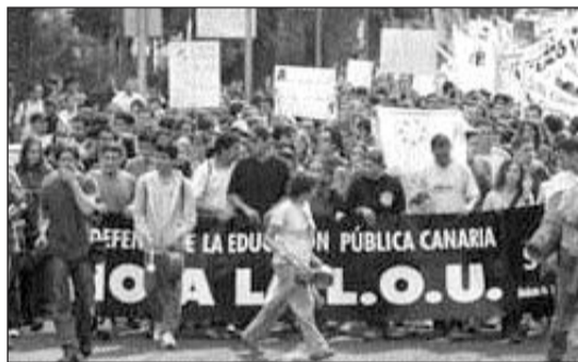
¿Seguro que la propuesta de Zapatero responde a las exigencias que llevaron a todos los sectores, desde alumnos a profesores, desde los institutos a las universidades, a movilizarse masivamente contra la reaccionaria política educativa del gobierno de Aznar?

Es necesario un plan de choque que coloque, de verdad, no sólo en el papel, la educación más excelsa al alcance de todos. Y la LOE de Zapatero está muy lejos de cumplir esta exigencia