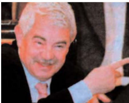
“Cuando unos pocos nos empujan hacia la división, el sentimiento de unidad en España es tan potente que acaba por traslucir por donde uno menos espera”

Maragall: “Hoy me siento más catalán y más español