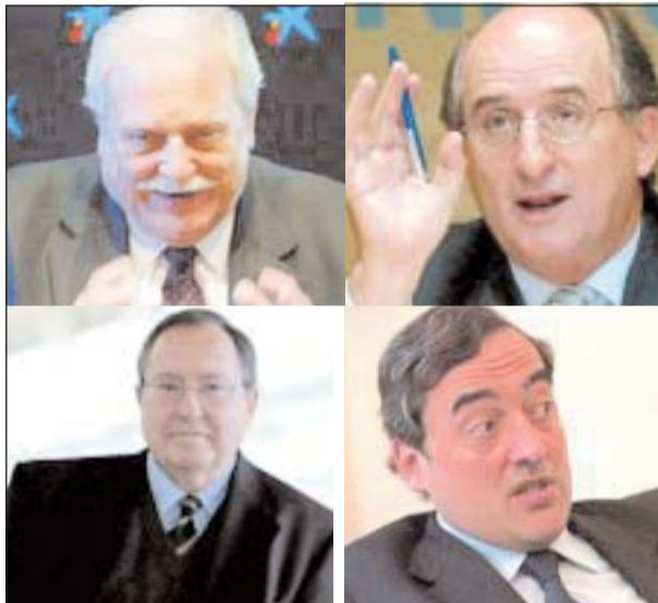
Del intercambio comercial con el resto de España la burguesía catalana obtiene, año tras otro, un superávit varias veces billonario. ¿Es pensable que renuncie a ellos movida por “sentimentales razones patrióticas” tan inaprensibles como improproductivas?

que tienen en el mercado español un suelo firme, un sólido punto de partida, el sostén imprescindible que les permite avanzar en su expansión. No existe prácticamente una sola empresa catalana cuya facturación y volumen de negocio no tenga como destinatario principal el mercado interior español.