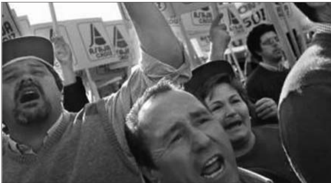
De las movilizaciones por separado las organizaciones agrarias han pasado a la unidad de acción, el 28 de noviembre en Madrid, si el gobierno no cede.

Obligados a escoger entre vivir en la miseria o desaparecer, esa es la espada de Damocles que pende sobre cada uno de los cientos de miles de pequeños y medianos agricultores, y que, ante la pasividad del gobierno, les obliga a salir a la calle.