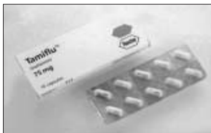
Roche lanzó en 1999 Tamiflu con un precio entre 36 y 44 euros, este año la empresa vende el Tamiflu a 377 euros, ¡un 100% de incremento en su precio!

Para que las piezas de este rompecabezas cuadren, es aquí donde entra Donald Rumsfeld. La misma CNN dio a conocer, que Rumsfeld es el principal accionista de Gilead Sciences, la compañía de biotecnología