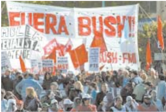
"Manifestación en Mar del Plata, de las muchas que se sucedieron en toda Argentina en rechazo a la política de los EEUU en Iberoamérica"

La presencia de Bush en Argentina, que busca recuperarse de la hecatombe económica provocada por las medidas del FMI, trajo consigo mucho ruido y también muchas nueces. Y es una muestra de las "pasiones" que levanta la política del hegemonismo en Iberoamérica.