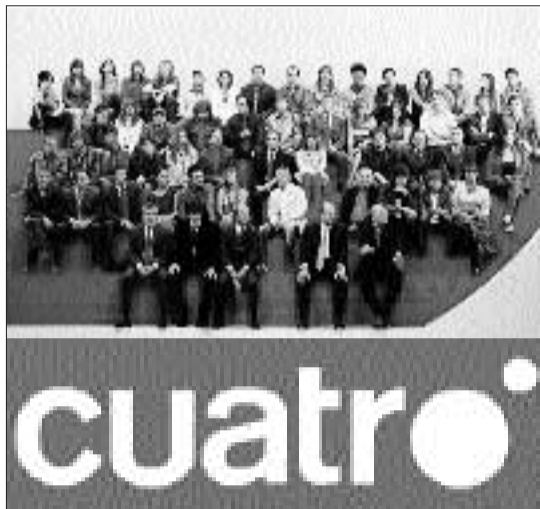
Con La Cuatro Prisa se lanza a buscar su hegemonía también en la televisión.

¿Se ampliaría la libertad de expresión y el pluralismo informativo en Italia dándole otra televisión u otra radio a Berlusconi?