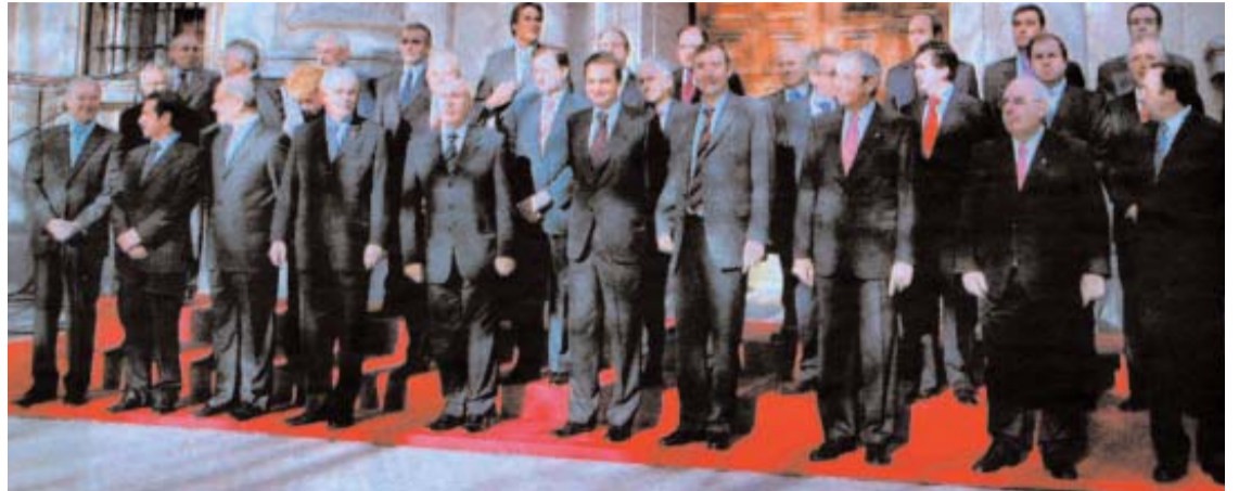
“De la experiencia histórica del siglo pasado mantenemos una lección política básica: el progreso y la libertad de Cataluña ha ido siempre asociado al progreso de la democracia española”. (Pasqual Maragall)

En un momento donde hay quien nos presenta a España como un conjunto sin alma de piezas débilmente engarzadas, en el fondo conforman un poderoso y unido bloque de granito. Y cuando unos pocos nos empujan hacia la división, el sentimiento de unidad en España es tan potente que acaba por traslucir por donde uno menos espera. Por ejemplo en una previsiblemente anodina reunión de presidentes autonómicos en el Senado.