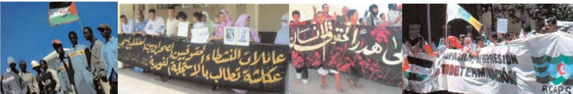
De derecha a izquierda: un grupo de inmigrantes subsaharianos, socorridos por los saharauis después de haber sido abandonados en el desierto por Mohamed VI; concentración de familiares de presos saharauis ante la prisión de Casablanca; manifestación en Assa, ciudad del sur de Marruecos en solidaridad con el pueblo saharauí; reciente manifestación en Tenerife.

Pero a pesar de la represión marroquí, se suceden las manifestaciones en las universidades, o las concentraciones en las calles de los territorios saharauis. Tal y como plantea el representante del Frente Polisario: "el pueblo saharauí, como el resto de los pueblos, tiene esa capacidad de resistencia ante toda agresión o injusticia impuesta por fuerzas de ocupación extranjera. La historia está llena de ejemplos similares. El pueblo español desarmado se levantó contra la invasión del poderoso ejército de Napoleón y terminó venciendo y recuperando su libertad. Los saharauis también continuaremos nuestra hasta la victoria final".