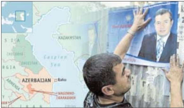
La región con capacidad para convertirse en la mayor abastecedora potencial de petróleo en el mundo tiene su centro geográfico en el Mar Caspio. Bakú, capital de Azerbaiyán es el nudo donde se entrecruzan tanto las rutas de los distintos oleoductos como los intereses geoestratégicos de las grandes potencias mundiales.

¿Preocupación por el desarrollo democrático, sensibilidad ante posibles violaciones a los derechos humanos? Nada más alejado de la realidad que considerar a Putin o a Bush desasosegados por estas cuestiones. Sino más bien porque Azerbaiyán se ha convertido en una codiciada pieza del tablero internacional. Incluso más que por sus recursos petrolíferos, por la posición geopolítica que ocupa.