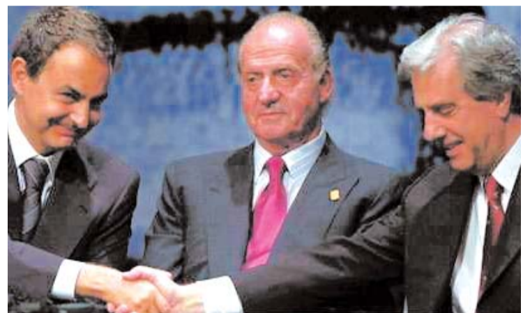
Zapatero, el Rey Don Juan Carlos y el presidente argentino Nestor Kirchner.

¿No tendría y podría ser España la plataforma de defensa de los intereses de Iberoamérica en Europa, y no al contrario, de los de las potencias europeas en Iberoamérica?