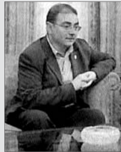
La actuación de Madrazo en el gobierno tripartito del PNV no tiene nada que ver con la línea histórica de los comunistas en defensa de la libertad y la unidad del conjunto del pueblo de las nacionalidades y regiones de España.

El régimen del nacionalismo étnico y excluyente y la línea nazifascista del nacionalismo vasco son las principales fuentes de oxigenación de la banda terrorista