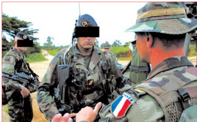
A través de las misiones para proteger extranjeros, “Turquesa” y “Amaryllis” tropas francesas protegen el avance del ejército ruandés y los escuadrones de la muerte hasta los campamentos de refugiados, donde se produce una de las mayores matanzas.

A través de las misiones para proteger extranjeros, las llamadas operaciones “Tur-