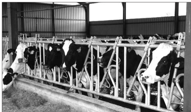
En el último año 2.040 ganaderos abandonaron sus explotaciones: la imposibilidad de crecer por la imposición de cuotas, desmoraliza a los productores y fomenta los abandonos de las explotaciones.

Es decir, planes para expulsar del mercado a miles de pequeños y medianos productores por el método de aplicar las "cuotas lecheras" y limitar su producción, haciendo que sus explotaciones no sean rentables y obligándoles "voluntariamente" a acogerse a los "planes de abandono". Estamos hablando de miles de familias que pasan a quedar