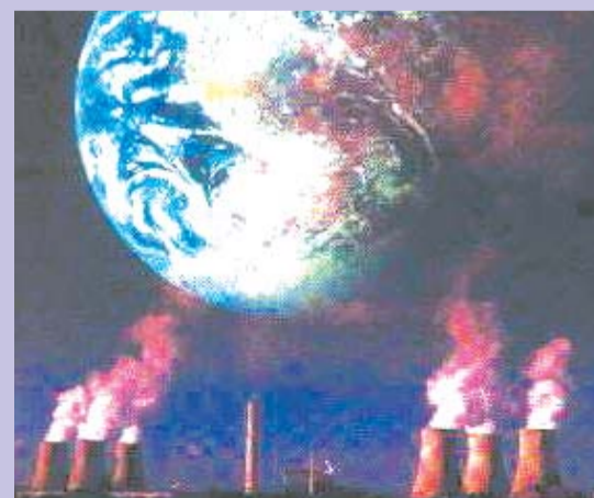
El bióxido de carbono y otros contaminantes del aire se acumulan en la atmósfera formando una capa cada vez más gruesa, atrapando el calor del sol y causando el calentamiento del planeta. El dióxido de carbono, principal gas invernadero, es liberado en la combustión de petróleo, gas y carbón.

La responsabilidad sobre este mundo que se está creando no es “de todos”, sino de un reducido puñado de familias que controlan los monopolios y las fuentes de energía. Por ejemplo, el principal origen de contaminación por la emisión de bióxido de carbono son las plantas de generación de energía a base de carbón, que emiten 2,500 millones de toneladas al año. La segunda causa principal de contaminación son los automóviles, emiten casi 1,500 millones de toneladas de CO2 al año. Sin embargo, son las grandes multinacionales fabricantes de coches han impedido activamente la fabricación del motor de agua o el desarrollo de prometedoras fuentes de energía alternativa a la gasolina, no contaminantes. Contaminando en búsqueda del beneficio inmediato e impidiendo el desarrollo de energías alternativas no contaminantes, los monopolios están envenenando al planeta y a la humanidad.