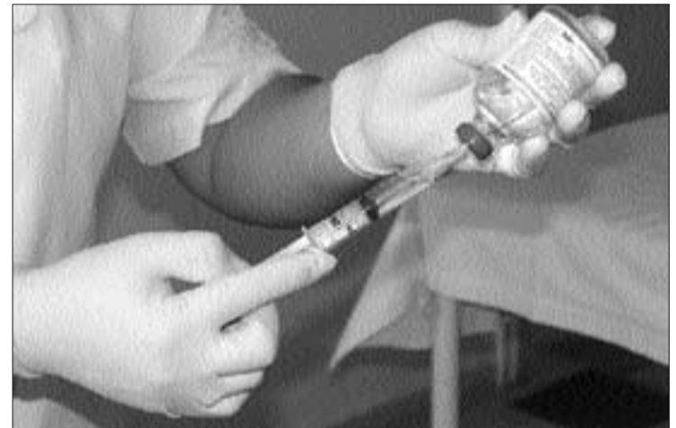
La aplicación de la eutanasia se nos presenta como una conquista basada en el reconocimiento de la libertad y los derechos individuales, pero se oculta que fue la precisamente la Alemania nazi la primera en ponerla en práctica.

Pero el empeño en la extensión de la eutanasia no obedece a cuestiones morales. Un periódico holandés afirmaba en 1999: “El futuro se presenta alarmante; un país rico, que sin embargo no quiere dedicar más presupuesto al cuidado de los ancianos más vulnerables; ciudadanos que consideran indigna la demencia y prefieren hacer desaparecer a los ancianos cuya situación va deteriorándose; y ancianos que no quieren molestar y van a firmar en masa peticiones para que se les aplique la eutanasia”. En Dinamarca no se