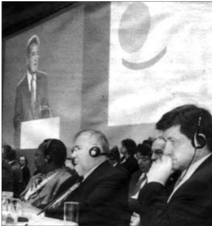
Sin fijar claramente los responsables de esta globalización y sin impulsar un cambio de base en el movimiento sindical, la CSI vuelve a ser una superestructura burocrática.

La CSI no identifica con claridad ni la naturaleza del problema, ni a los enemigos con los que se ha de enfrentar el movimiento obrero. Lo fundamental de la globalización no es que hay "efectos perniciosos", evidentes, es que hay explotación y, por lo tanto, explotadores y explotados. No es que hay "desigualdades", también evi-