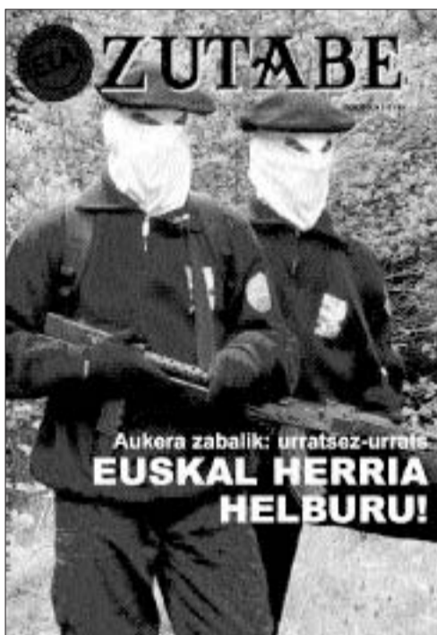
La banda terrorista ha llegado a este “proceso” más débil y aislada que nunca, si respira ahora con más fuerza que hace unos meses, es porque alguien le da oxígeno

Aprovechan cualquier oportunidad para despojar a los etarras